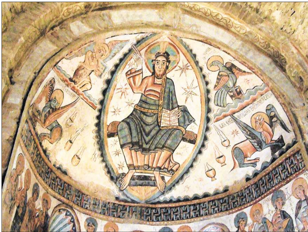
Fresco romanico en la baselgia da Castell de Mur (Catalugna/Spagna, ca. 1050).

Sche la romanica creescha damai maletgs en picturas e plasticas, na vulan quels betg vegnir interpretads e declarads intellectualmain, mabain vulan gidar a sviluppar las abilitads da l'olma e dal spiert uman. Ina represchentaziun da la vita e da la passiu da Cristus na vul betg be esser istorgia, raquintar il passà, mabain dar l'impressiun che quels eveniments hajan lieu uss ed en l'avegnir. Perquai numna Walter Myss il palantschieu sura da S.