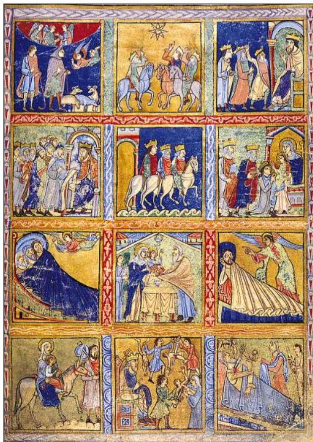
L'istorgia da Nadal sco pictura da cudesch (Canterbury/Engalterra ca. 1140).